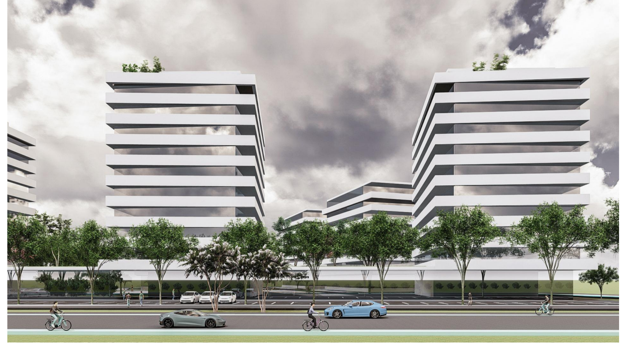
PERSPECTIVA CLADIRI BLOCURI VEDERE DINSPRE CALEA AUREL VLAICU