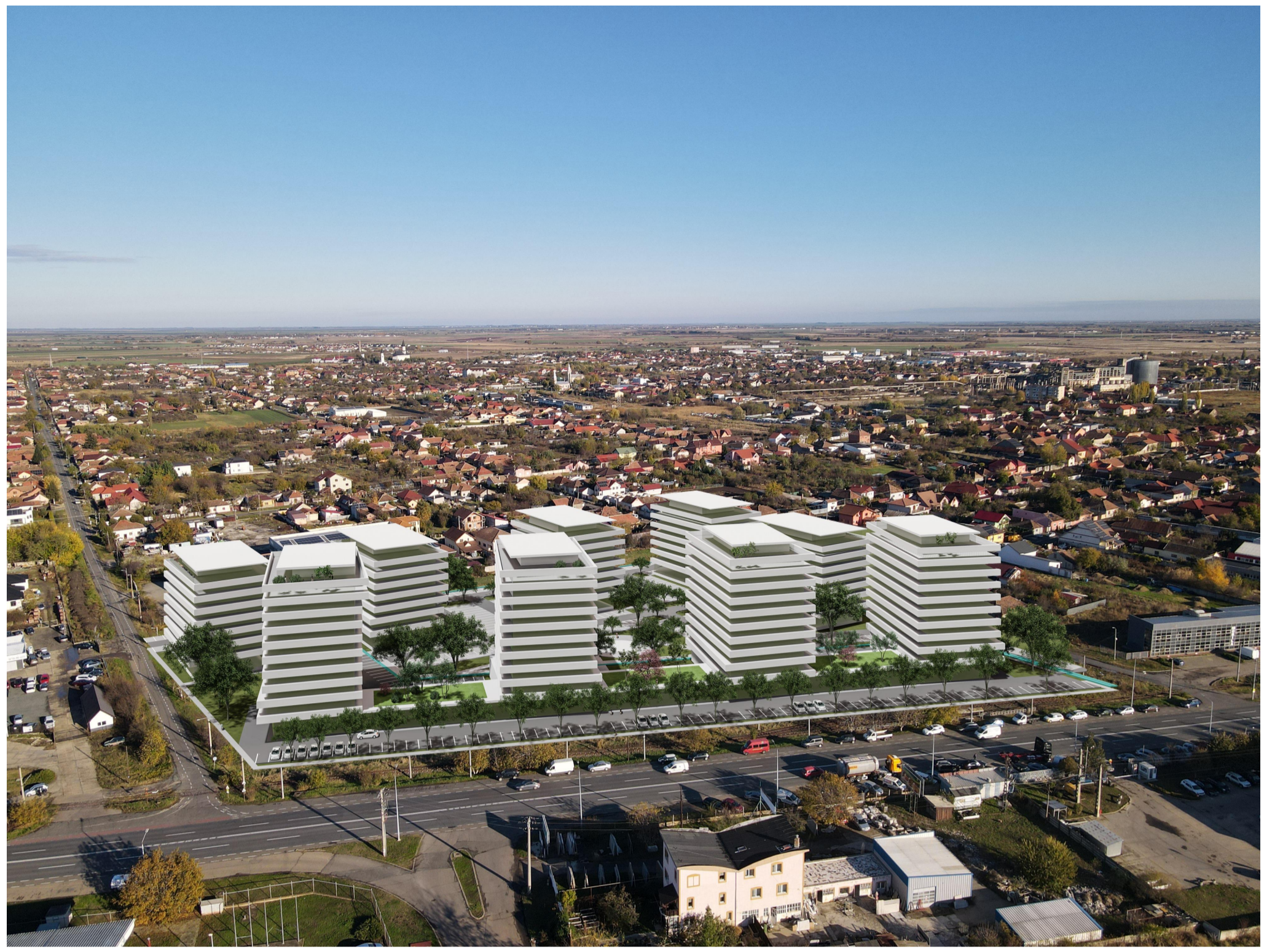
PERSPECTIVA INSERTIE VOLUMETRICĂ ÎN SITU