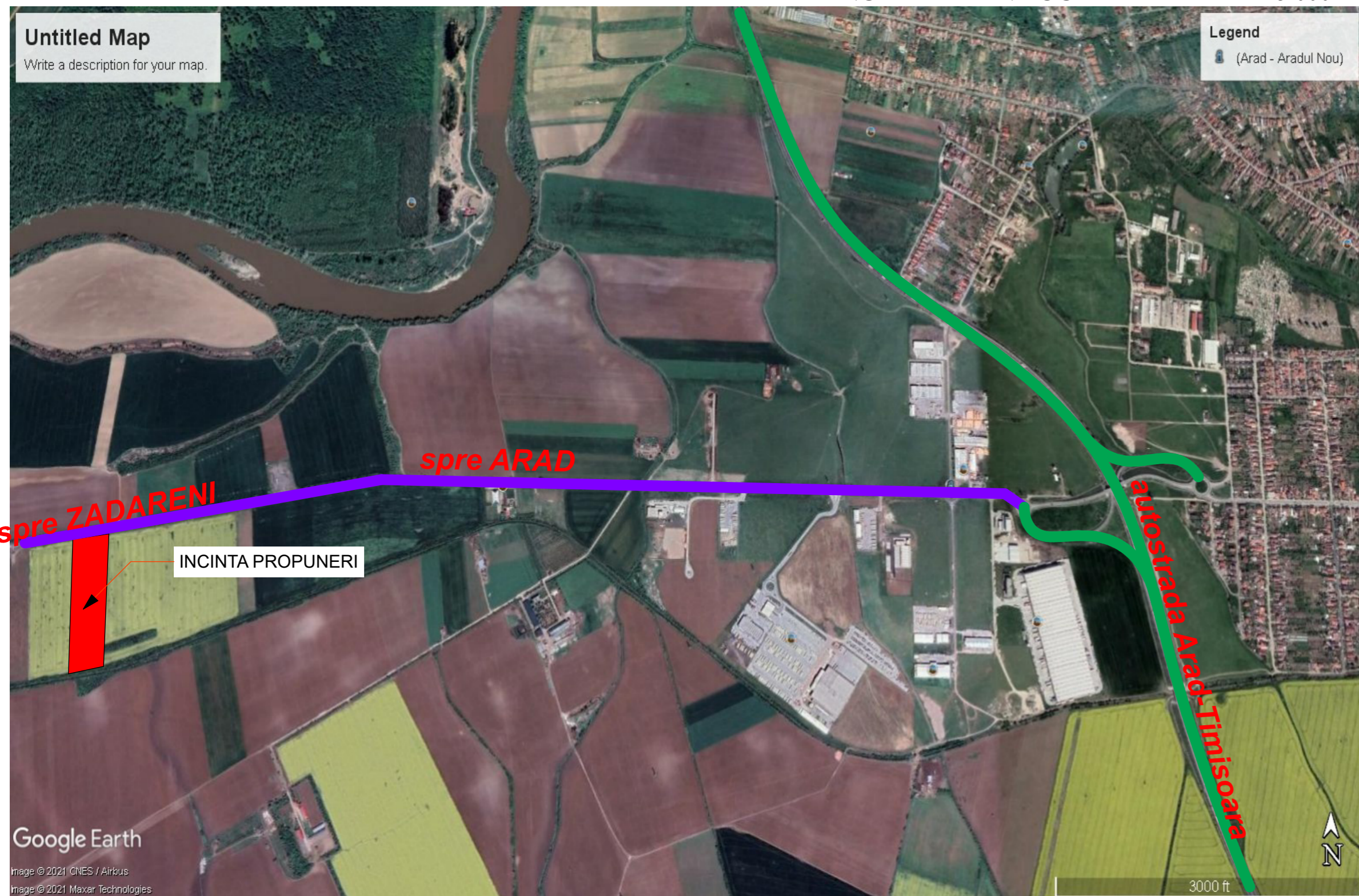
INCADRARE IN LOCALITATE - scara 1:5.000