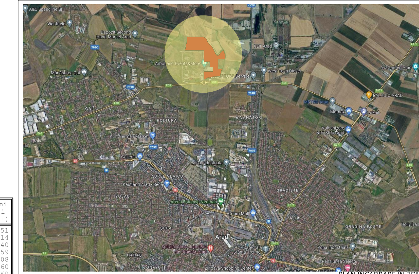
PLAN ÎNCADRARE ÎN ZONĂ

AMPLASAMENT: JUDEȚ ARAD, MUNICIPIUL ARAD, IDENTIFICAT PRIN CF 342301, 347549, 348667, 348671, 348672, 348673, 348675, 348676, 348677, 348680, 348681, 348682, 348683, 348684, 348685, 348686, 348687, 348688, 348689, 348690, 348691, 348692, 348693, 348694, 348695, 348698, 348699 Arad