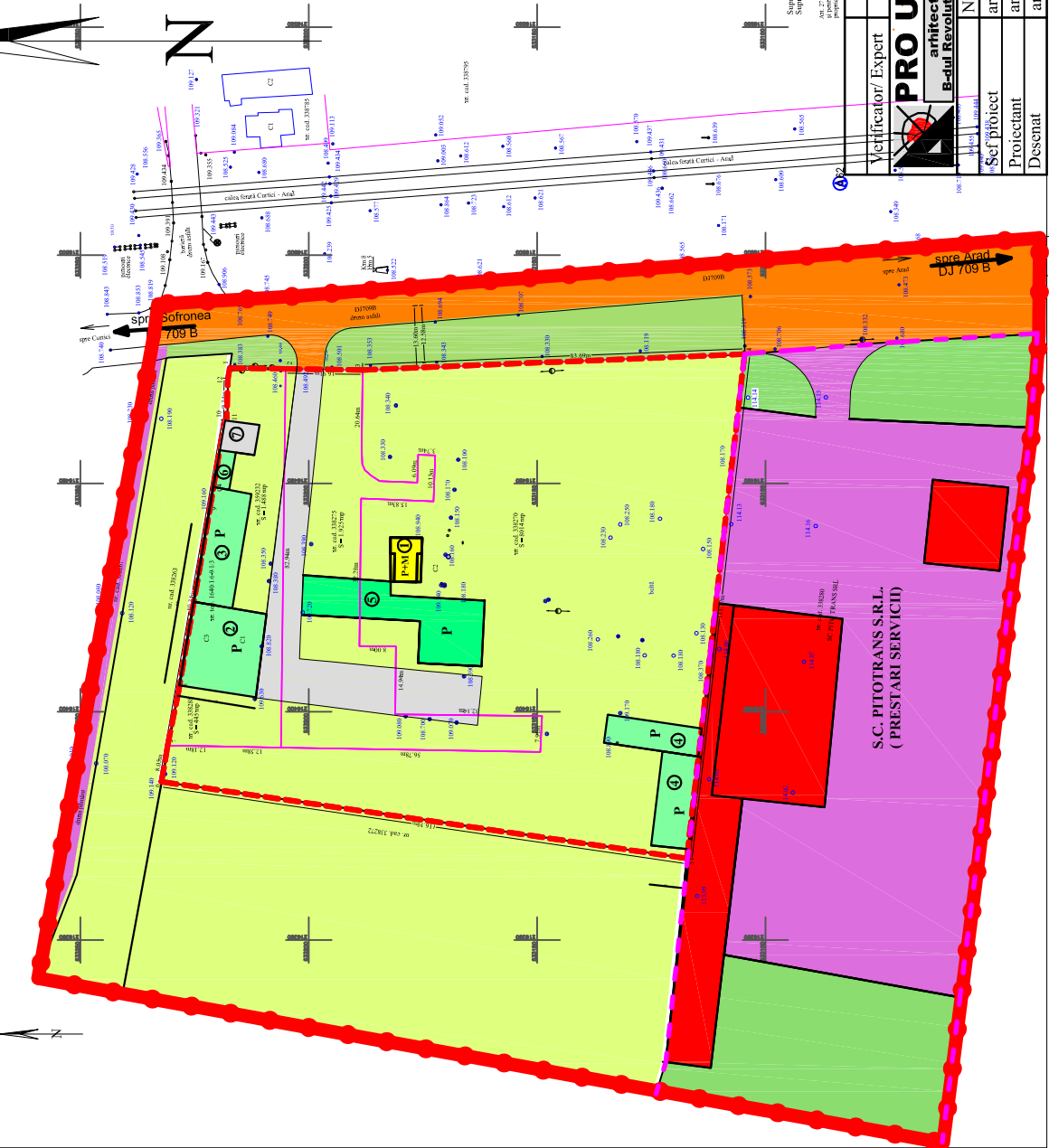
PLAN TOPOGRAFIC ANALOGIC SI DIGITAL scara 1:500