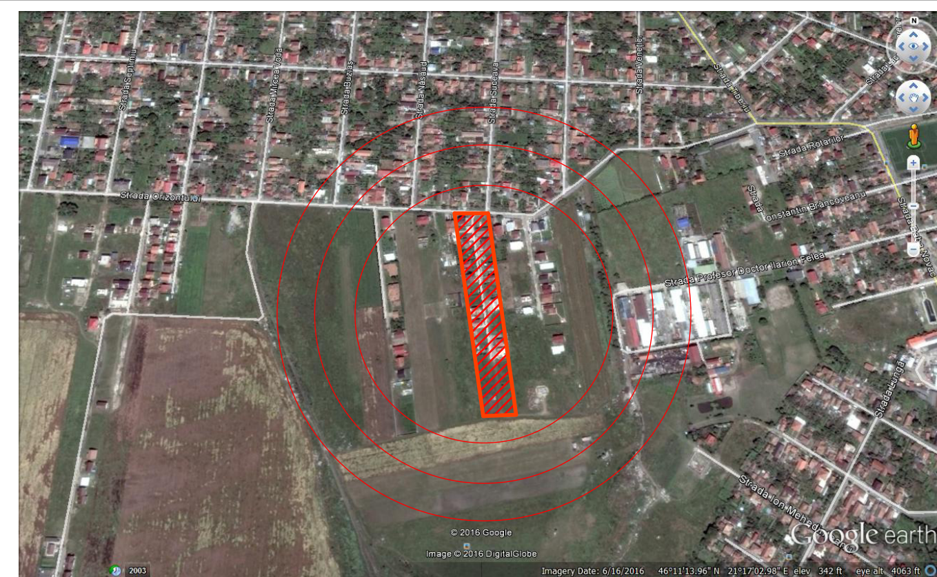
PLAN INCADRARE ZONA Scara 1:10000

PUZ aprobat HCL 301/2007 Beneficiar: GABOR PETRU