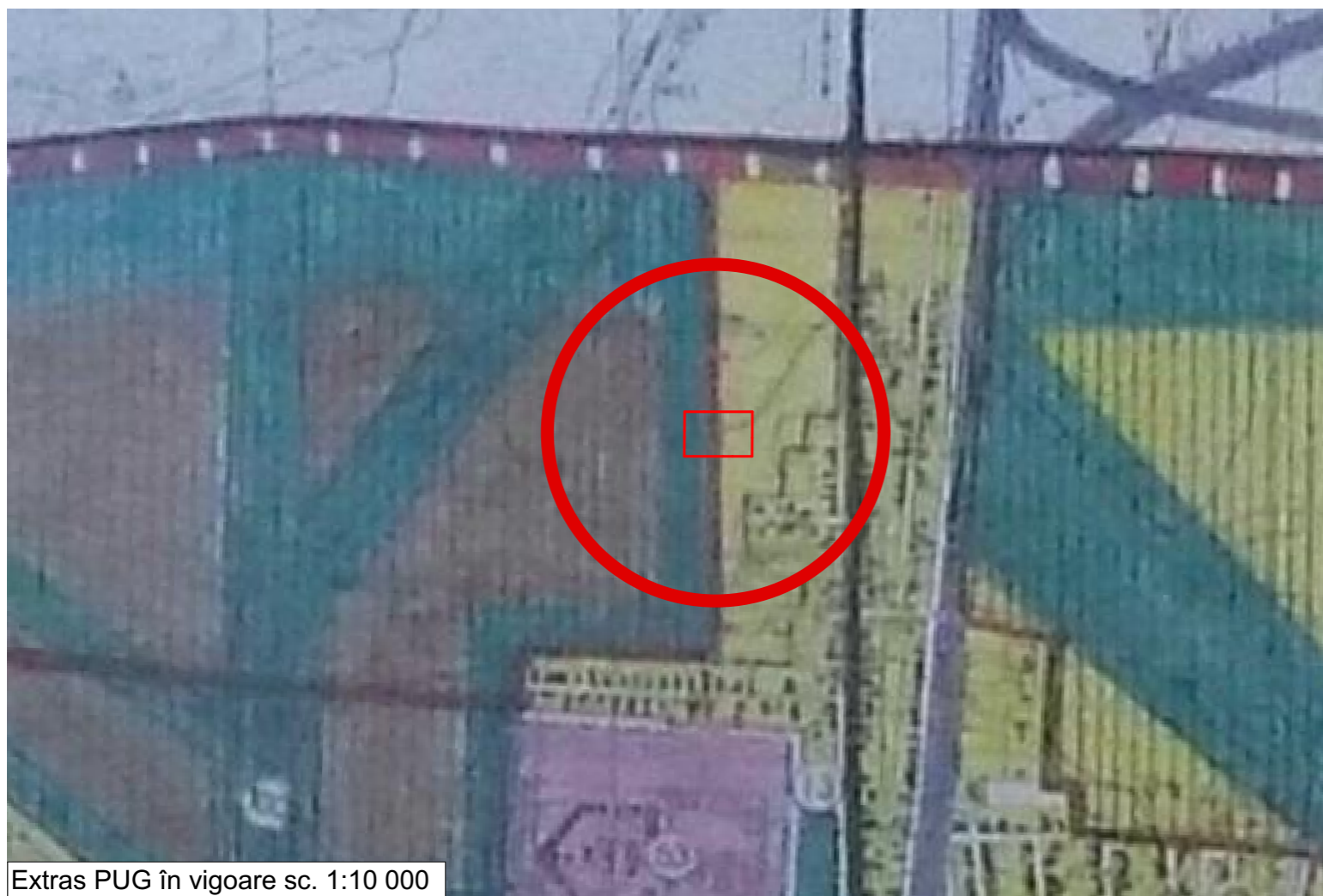
Extras PUG în vigoare sc. 1:10 000