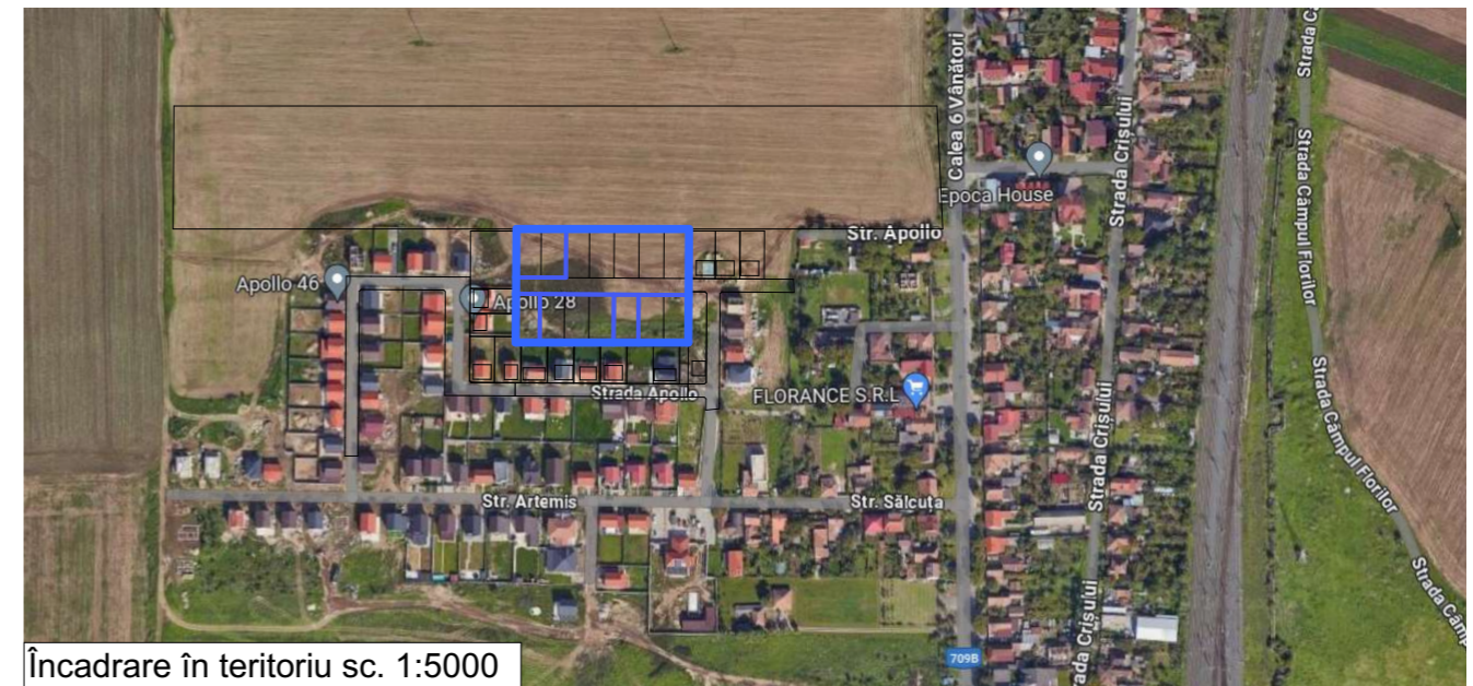
Încadrare în teritoriu sc. 1:5000

ZONA LOCUINȚE INDIVIDUALE - Intravilan Arad CF 365376, 365375, 365310, 365308, 365311, 364994 jud.Arad